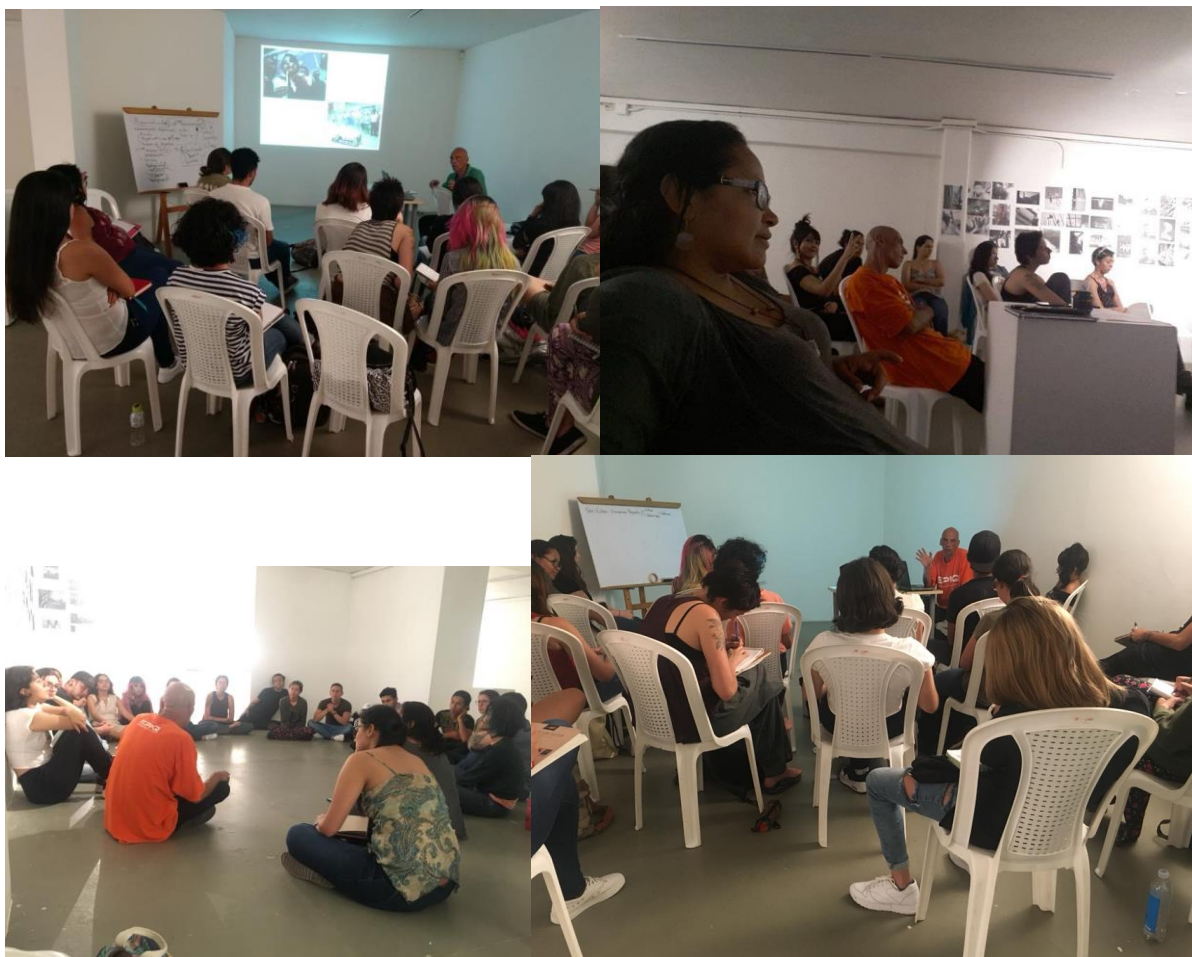
Conversatorios con artistas y estudiantes de la Universidad de Antioquia - Fundación Universitaria de Bellas Artes en Medellín.

Estos conversatorios se desarrollaron dentro de la Cátedra internacional de Fotografía y performance Universidad de Antioquia - Fundación Universitaria Bellas Artes en Medellín, Colombia donde fui invitado en el marco de la exposición Memorias de lo Invisible que se presentó en el Museo de la Universidad de Antioquia, durante la segunda quincena de Agosto de 2018.